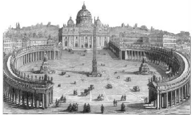
CHURCH OF ST. PETER, ROME

U NA de las principales doctrinas del romanismo enseña que el